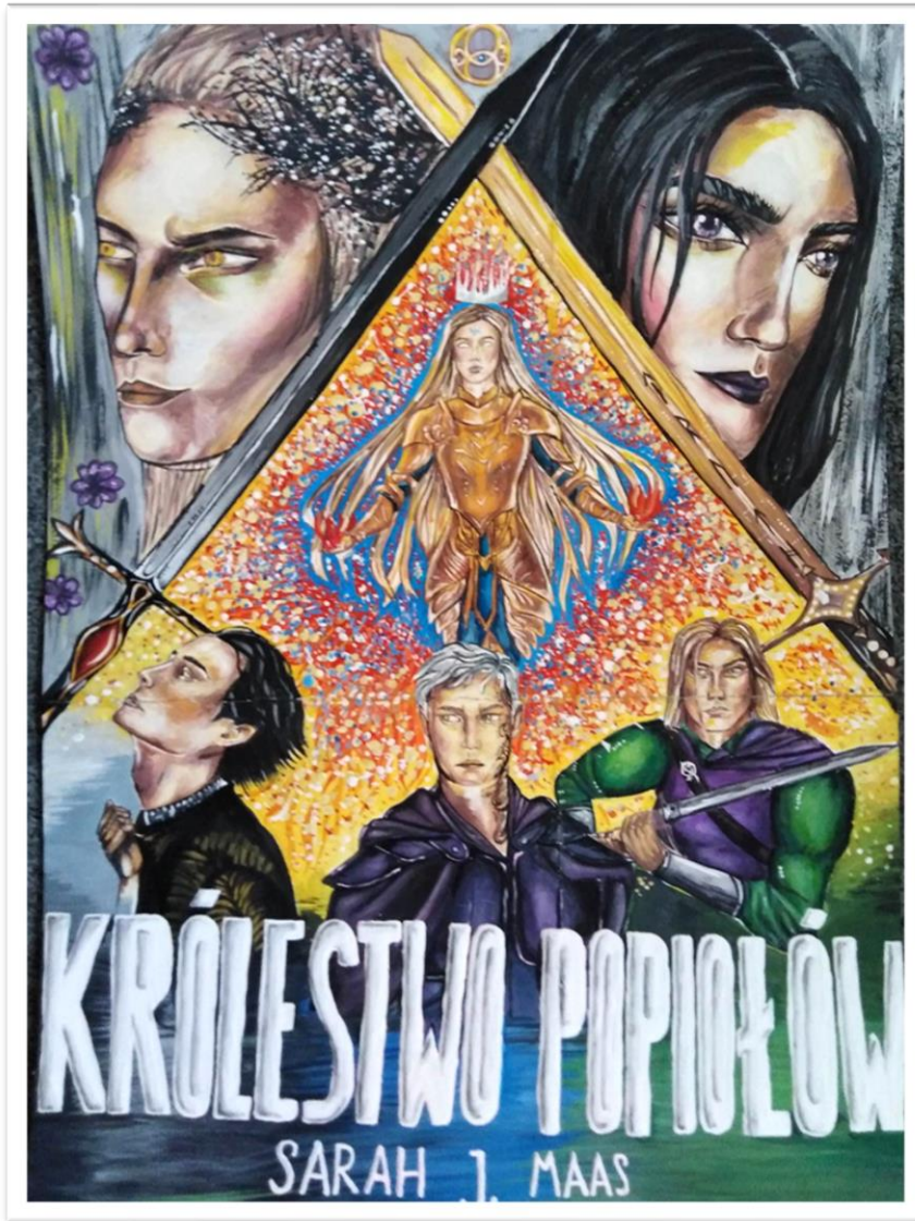
projekt okładki: Nikoletta Duduś, kl. 4 A